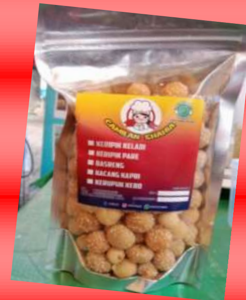
Profil Usaha Ekraf

Sejarah berdirinya usaha camilan shahia itu kembang surut, sebelum pemilik memiliki usaha keripik, pemilik membuat jajanan basah untuk di bawa ke pasar, karena covid semua pada membuat jajan, jadi pemilik beralih membuat keripik keladi. Pada awal mulanya tanu 2018 hanya membuat sedikit. Seiring waktu berjalan, saya mengikut seminar/ diklat. Pada diklat tersebut pemilik belajar membuat kemasan produk yang bagus agar menarik untuk dipasarkan selain itu agar produknya awet.